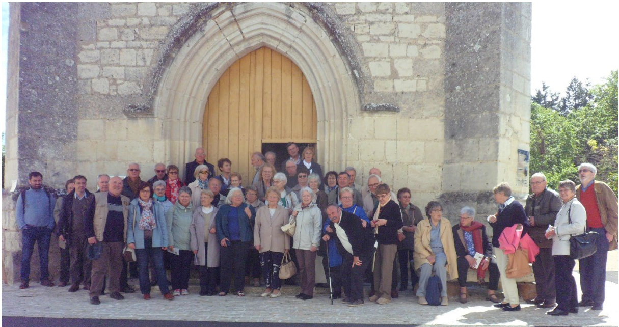
Visite de l'église de la Chapelle Blanche Saint-Martin