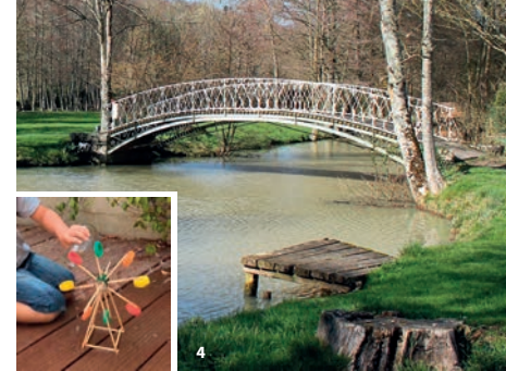
1. Défis patrimoine 2. Le Cher à vélo