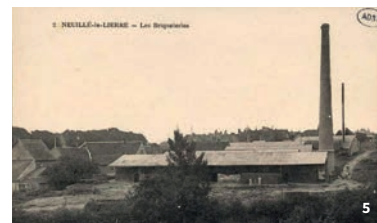
1. Le Vieux Palais de Limeray 2. L'église de Chançay 3. L'église de Vernou 4. Détail sculpté de la façade de la Maison des pages à Chenonceaux 5. Ancienne briqueterie de Neuillé-le-Lierre 6. Portail de l'église de Villedômer