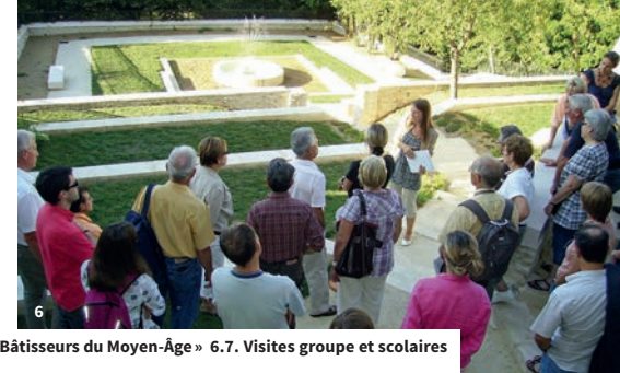
4. Visite de l'église de Cangey 5. Atelier « Bâtisseurs du Moyen-Âge » 6. 7. Visites groupe et scolaires à Montlouis-sur-Loire