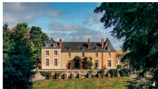
1. Château de Noizay © PAH LT 2. Château de la Noue © Région Centre-Val de Loire, Inventaire général, T. Cantalupo 3. Château de Fontenay © N. Carli 4. La façade sur le plan d'eau © Château de la Huberdière 5. Les espaces troglodytiques © Le Gaimont 6. Château du Mortier © PAH LT