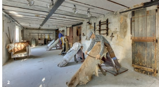
1. Musée de l'Hôtel Morin 2. Musée du Cuir et de la Tannerie 3. Faune des bords de Loire