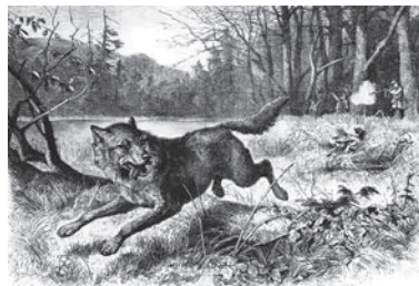
Le loup !